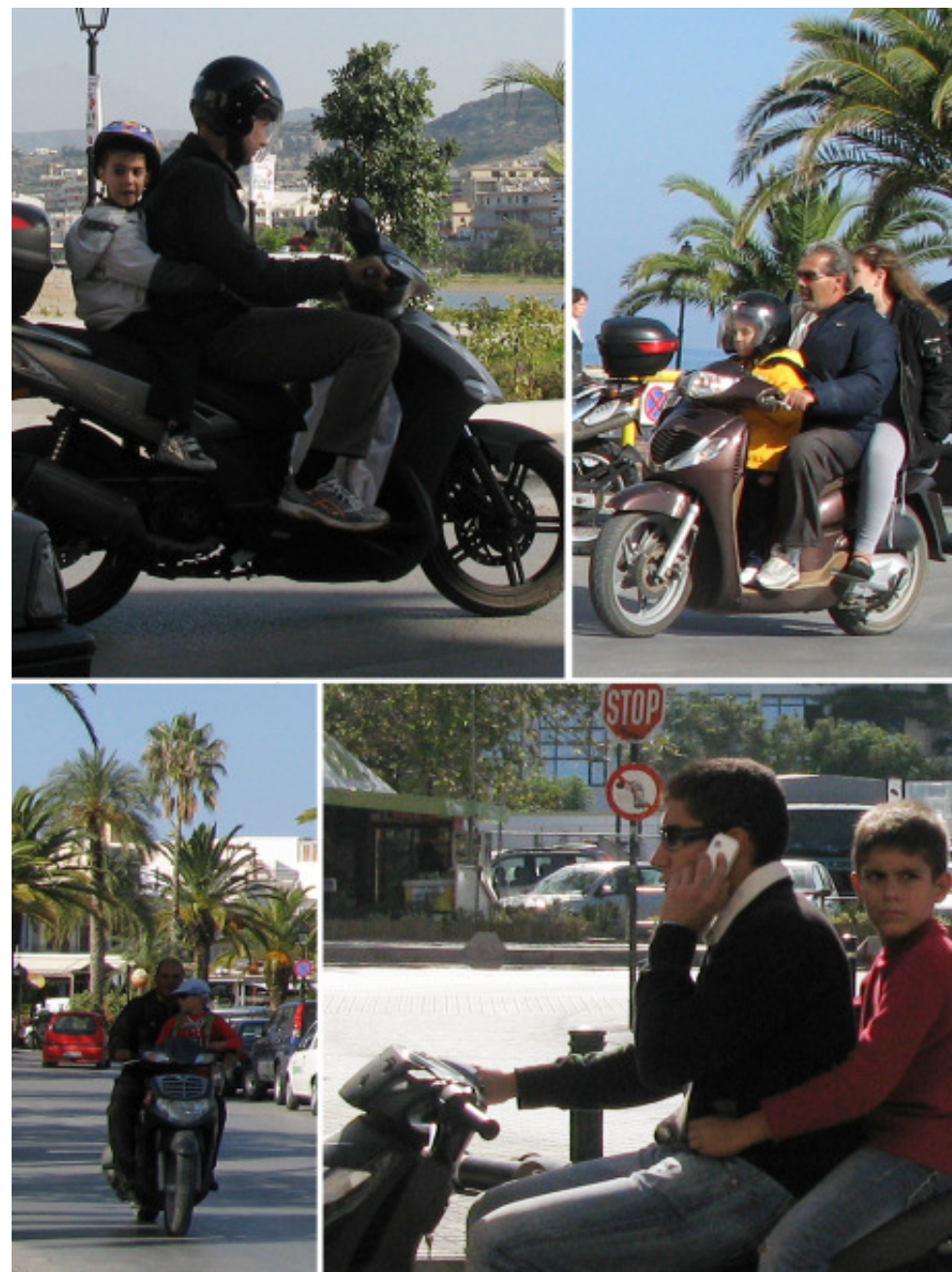
Ibland är det fyra på en moped

Om du har möjlighet så efterlyses det ofta någon som kan ta med sig ett djur på flyget till det nya hemmet.