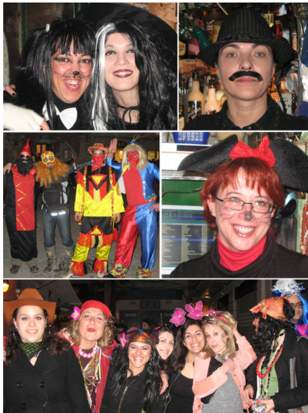
Torsdag före karnevalen, fest på stan!

Jag var inbjuden till en tjejmiddag hos en vän till en vän. Vi satt i köket i deras hus och där fanns en intressant hörna som såg ut som ett illa placerat skafferi utan dörr eller ja, något annat. Jag frågade vad det var och då berättade hon att det var han som ägde huset intill som passat på att flytta lite på väggen när huset stod tomt, han ville ha några kvm till för att kunna få ett rum till på sitt pensionat. Så han knyckte helt enkelt en