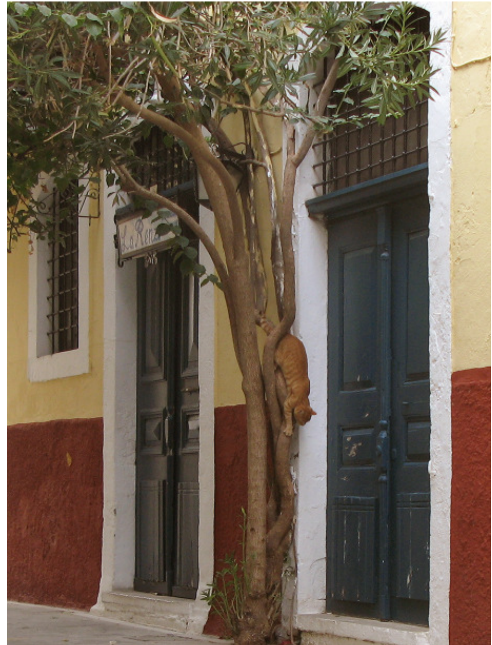
Matdags på vår gata

För dig som inte klarar dig utan en hederlig kopp svenskt kaffe en hel semester, eller helt enkelt bara blir lite sugen på något som smakar som