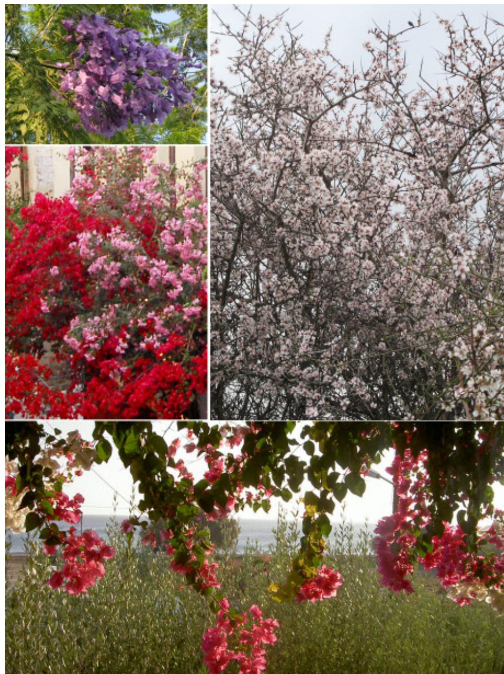
Från Rethymnos flora vår o vinter

Nästa gång plånboken försvann var, ja tro det eller ej, efter en julmessa i kyrkan och middag med prästen. Nåväl vi var några som gick vidare och så småningom så hamnade jag på Irländska puben med några vänner. Kvällen därpå upptäcker jag att plånboken är borta, vi efterlyste den på ställena jag varit men ingen hade sett någon plånbok. Jag hörde med en av mina kompisar och jo då hon kunde berätta att jag vänt upp och ner på väskan på puben. Oh hemska tanke. Vid det laget hade jag börjat ge upp om den och insåg att den nog hamnat i soporna. Vilket den också hade gjort. Men vid 22-tiden på kvällen ringer det på dörren och en glatt