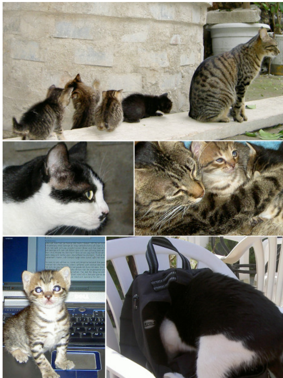
Miss Felix och Råttan med sina ungar

När vi så småningom trillade över ett bättre, eller kanske inte bättre men större, boende (tre rum och kök, vilken lycka) och flyttade från pensionatet tog vi med oss Råttan. Vi var tvungna att prova om hon ville fortsätta bo med oss, men det ville hon inte, trodde vi för vi blev genast av med henne och hon fanns ingenstans. Jag letade överallt, gick tillbaka till pensionatet men nä hon fanns bara inte. Flera timmar senare så fick vi ge oss och vara nöjda med att vi försökte i alla fall och se just då traskar Råttan in från balkongen mellan oss där vi står, sträcker lite på