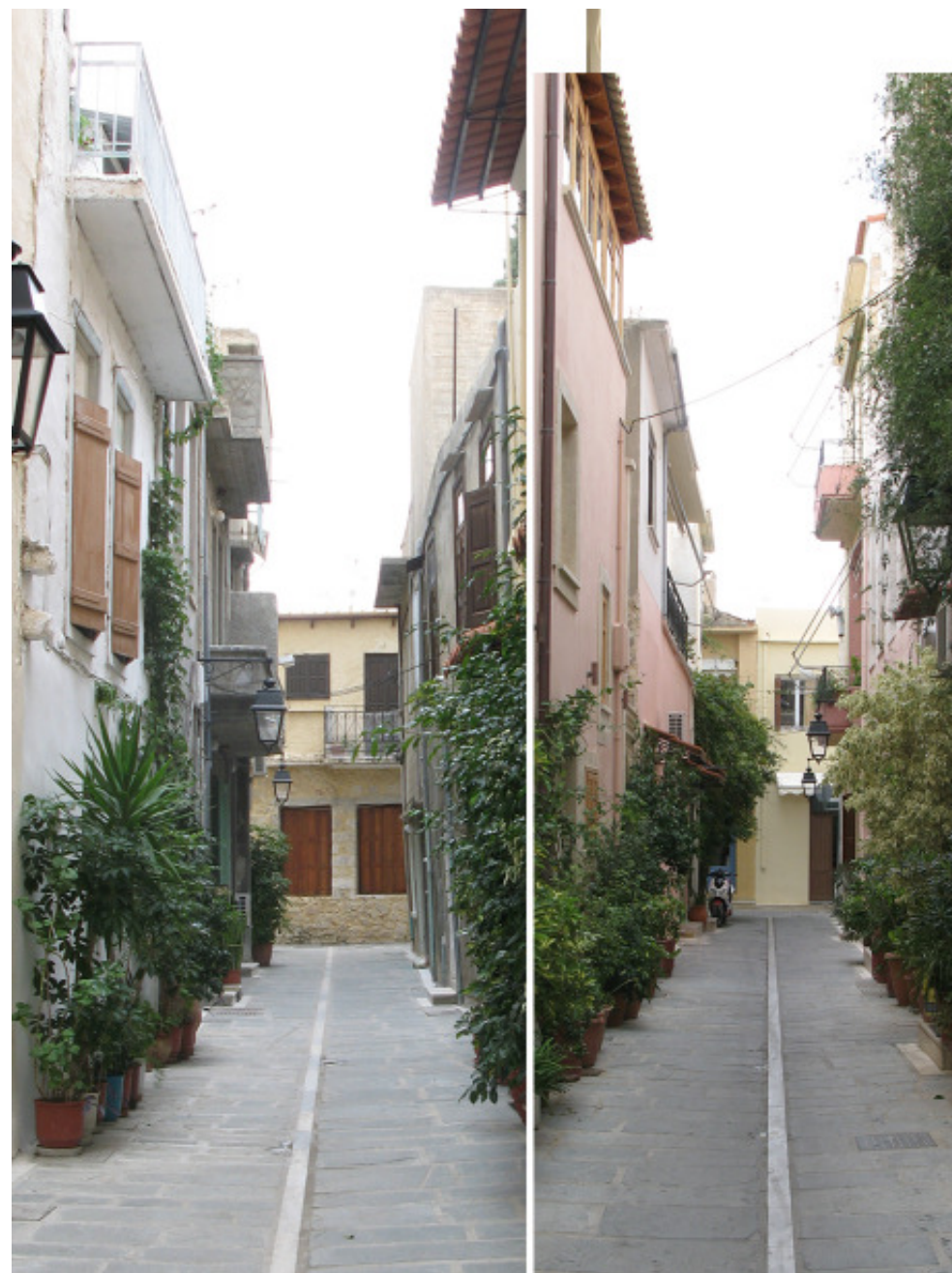
Traska gata upp och gata ner i de många grändernas stad!

Ett annat problem var att bestämma möte, det visade sig att ofta var äga-