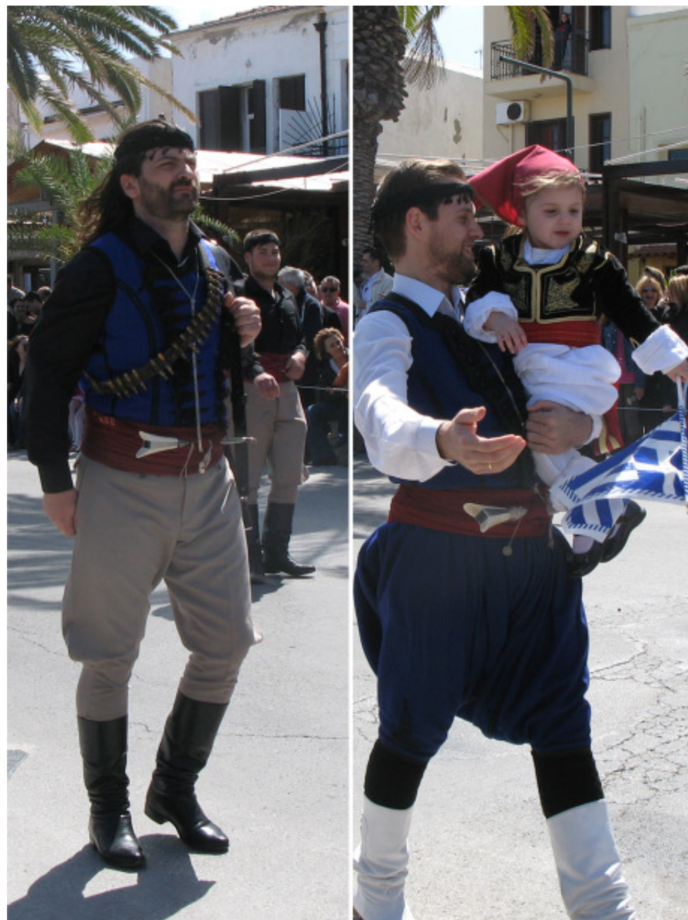
Parad på Nationaldagen