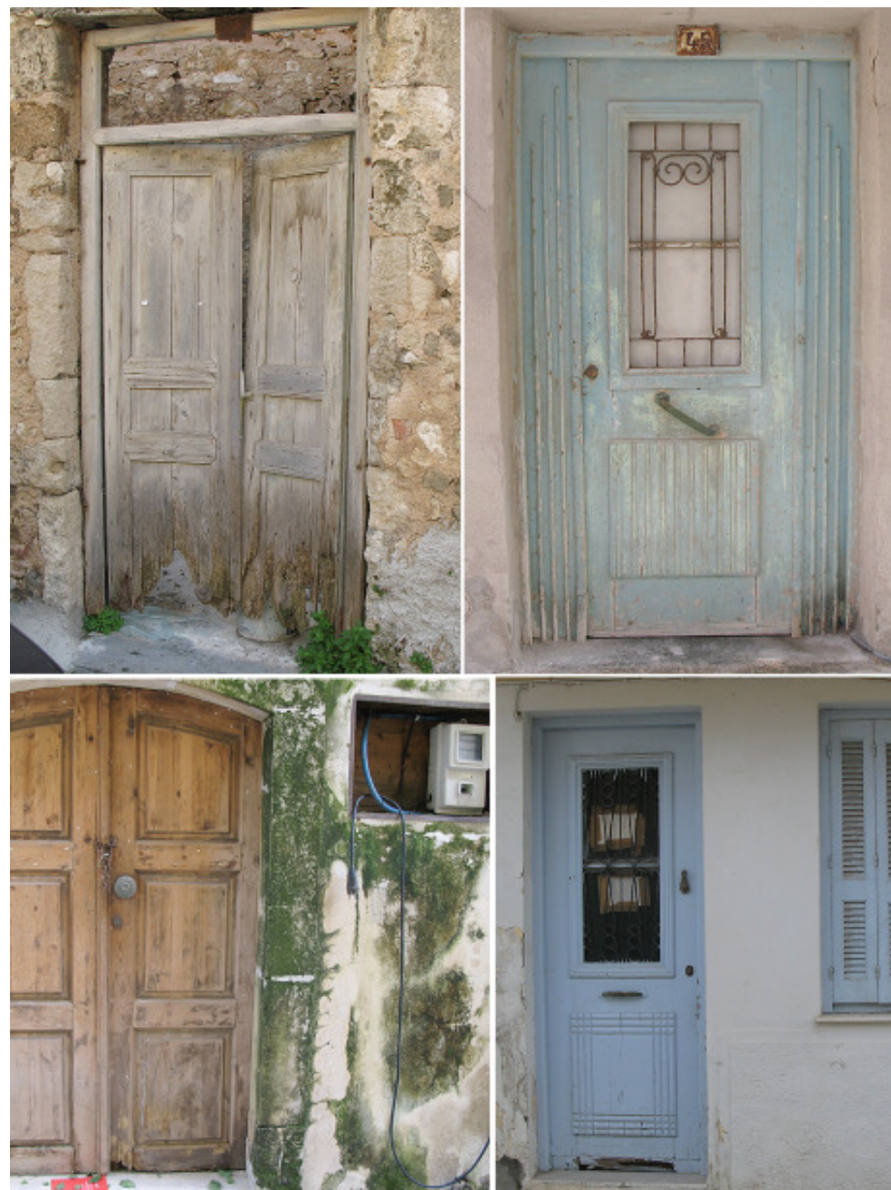
Dessa härliga gamla dörrar!

Kom gärna ner i förväg med lätt bagage, boka in er en vecka på ett pensionat och leta upp någonstans att bo. Försök att hitta något möblerat eller halvmöblerat till att börja med, gärna även med de viktigaste husgeråden, kastrull, stekpanna, lite glas, tallrikar och muggar. De flesta lägenheter är tomma när man hyr dem så man måste köpa spis, kyl, frys, tvättmaskin, värmekällor, ev även skåp mm, ja allt det som vi är vana vid att det finns i en lägenhet. Fråga om el och vatten ingår i hyran, det gör det oftast inte. Fråga om det går att få varmvatten både i kök och badrum, det är inte självklart här nere. Om det finns element, fråga om du bestämmer själv när de skall slås på för det är inte givet. När ett par goda vänner till oss var och letade efter lägenhet så var de och tittade på en lägenhet som inte var utrustad med ytterdörr, det hängde ett draperi, hyresvärdinnan var helt oförstående när de förklarade det otänkbara i att bo utan en riktig dörr. Det finns en hel del till uthyrning men det kan ta ett tag att hitta något som man kan tänka sig att bo i. I de flesta fall är det så att du måste vara beredd att sänka din standard när det gäller boende. Ofta oisolerat och glöm det där med täta treglasfönster, man får vara nöjd om fönster är hela och dörrar passar i sina hål. Genomluftning brukar man däremot inte behöva bekymra sig om!