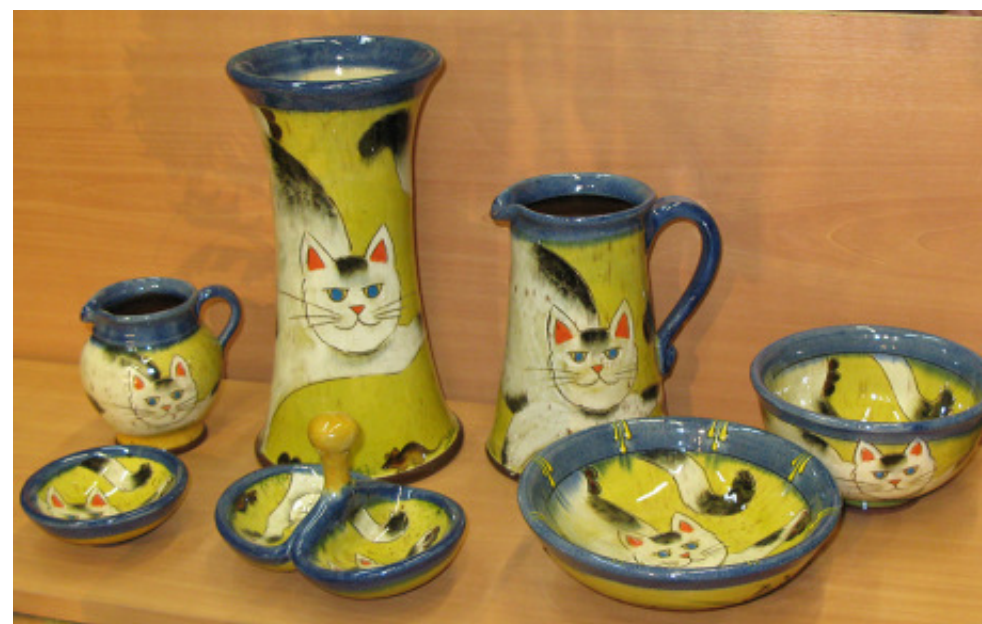
Keramik hos Omodamos och Träarbeten hos Siragas