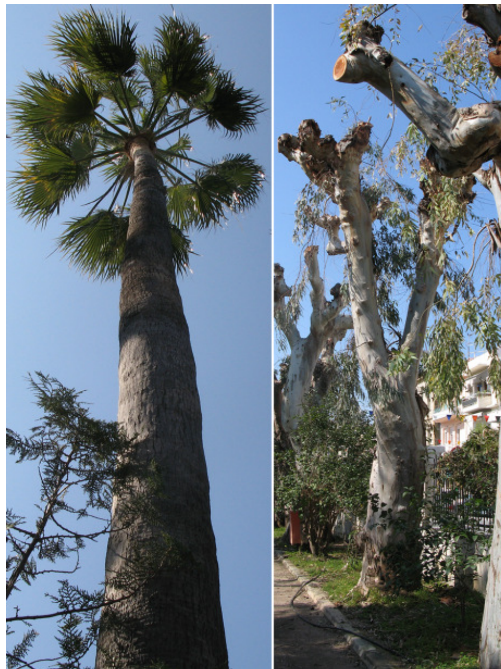
Vinterbilder från stadsparken