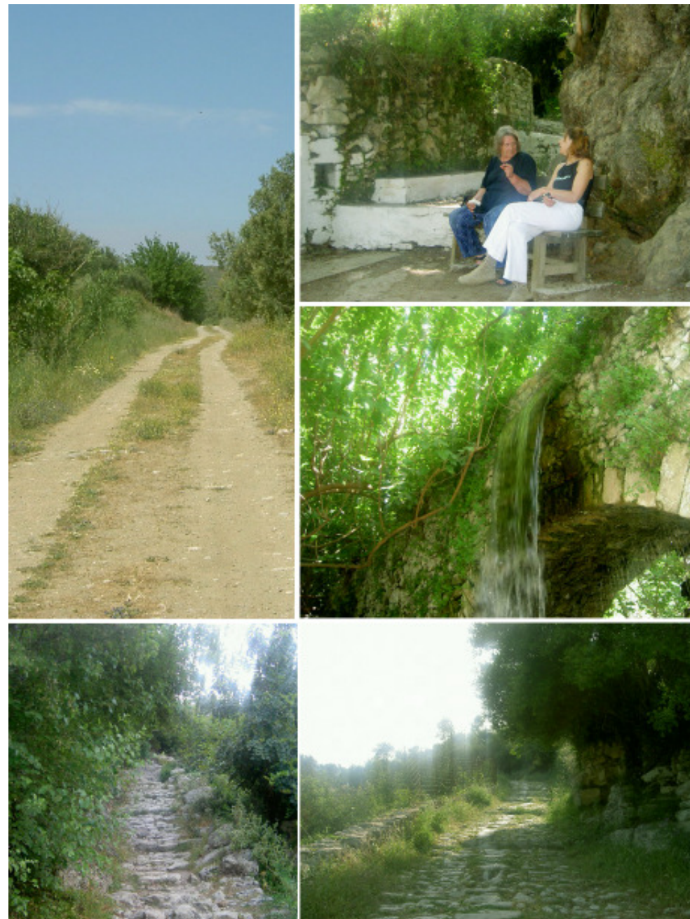
Bilder från Milli och Argiroupoli

Jag var och hälsade på en vän som "trillat ner för en trappa" för några år sedan och det var första gången jag fick se hur det såg ut. Hon blev inlagd och fick frågor ett flertal gånger hur den trappan egentligen såg ut, fast hon vidhöll med en dåres envishet att det var en vanlig trappa så det fick stanna vid det. När jag var där så började hon känna av migränanfall och behövde något för att stoppa det, jag gjorde flera försök att be om en tablett till henne, det gick inte, jag fick ge upp och bege mig ut på stan efter några piller. På första apoteket råkade jag säga att det var till en vän på sjukhuset, varpå de slet asken ur handen på mig och sa att jag absolut inte fick köpa ut något till någon som låg inlagd, det är säkert en klok regel men snopen blev jag när jag fick gå därifrån tomhänt. Men vad göra, skulle jag låta henne ligga där med migrän? Vidare till nästa öppna apotek och där höll jag tyst vad gällde omständigheterna och då gick det bättre så hon kunde få hjälp mot sin migrän.