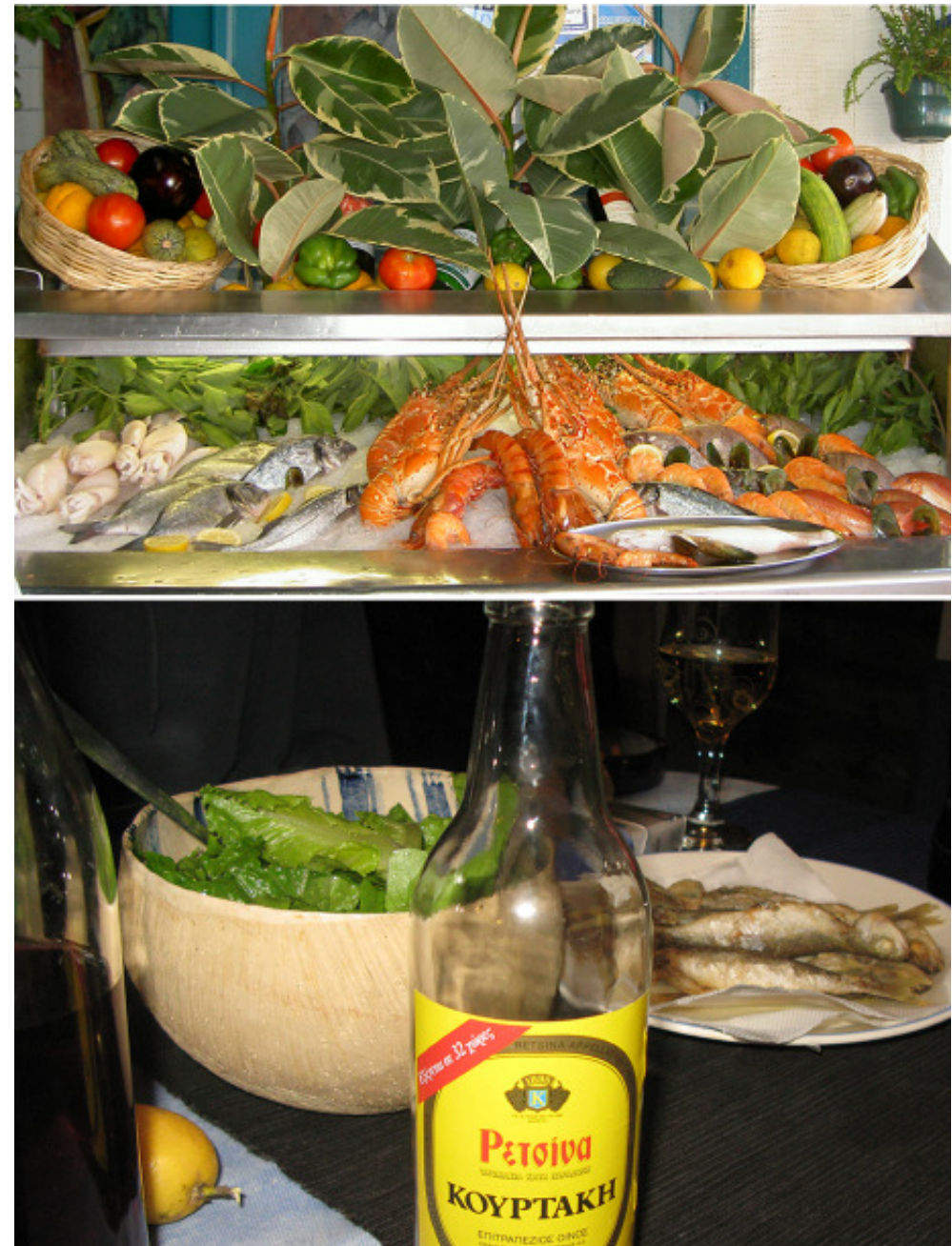
En klassiker, havets läckerheter och Retsina

Själv tycker jag det är helt sanslöst att det går vägen och så klart en kväll hände det. Det ringde på dörren (Jan 2009) och upp kom en spattig kille jag aldrig hade sett och skrek att det var helt oacceptabel hög nivå (vilket han i och för sig hade helt rätt i). Det var en grannes son som plötsligt hade flyttat hem till föräldrarna tvärs över. Nåväl han hotade med att ringa polisen, men eftersom tidpunkten var efter siesta och innan kl 22 på kvällen så tror vi inte att de hade dykt upp. Mer om just denne granne i kapitlet Grannar.