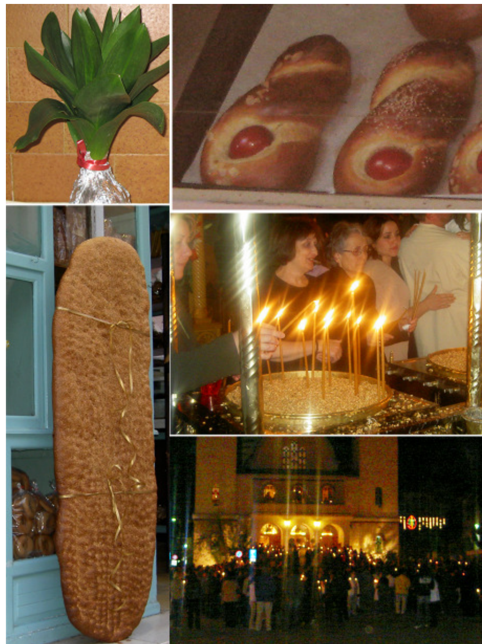
Påsk och brödet som äts på rena måndagen nere till vänster.

15 aug, Religiös helgdag för jungfru Maria. Många gör en pilgrimsfärd till ön Tinos för att bli botade från sjukdom eller för välsignelse.