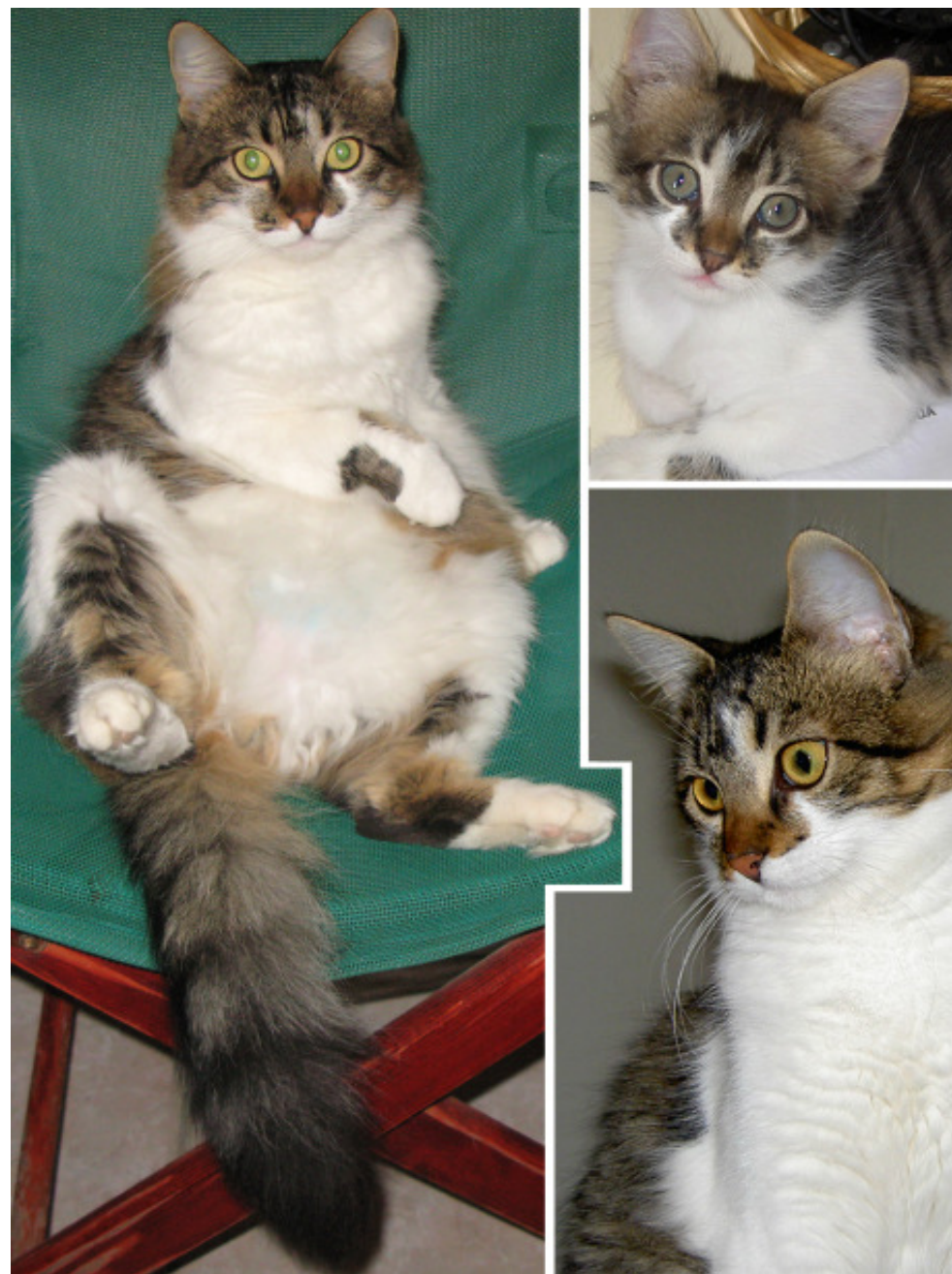
Vår Loppan knäppis-katt!

En vän till oss sa, låtsas inte om att ni har hört det där med översättning, gör som en grek hade gjort. Och det gjorde vi. Rätt person på hamnpolisen var inte där på fredagen så det fick vänta över helgen. Alltså om inte rätt person är på plats så får man inget utträttat här nere. Måndag