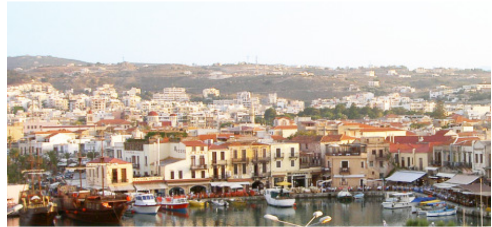
Hamnen och fyra martyrs torg

Man kan lätt få för sig att männen mest sitter på lokala caféet "Kafe neo" och gör ingenting, men ofta är det för att hålla sig underrättad om vad som händer och ofta sitter de inte där så länge. "Kafe neo" är ofta träffpunkten när man vill ha tag i en rörmokare eller "vattenman". Att kvinnor besöker "Kafe neo" är ovanligt, förr var det inte passande så det är