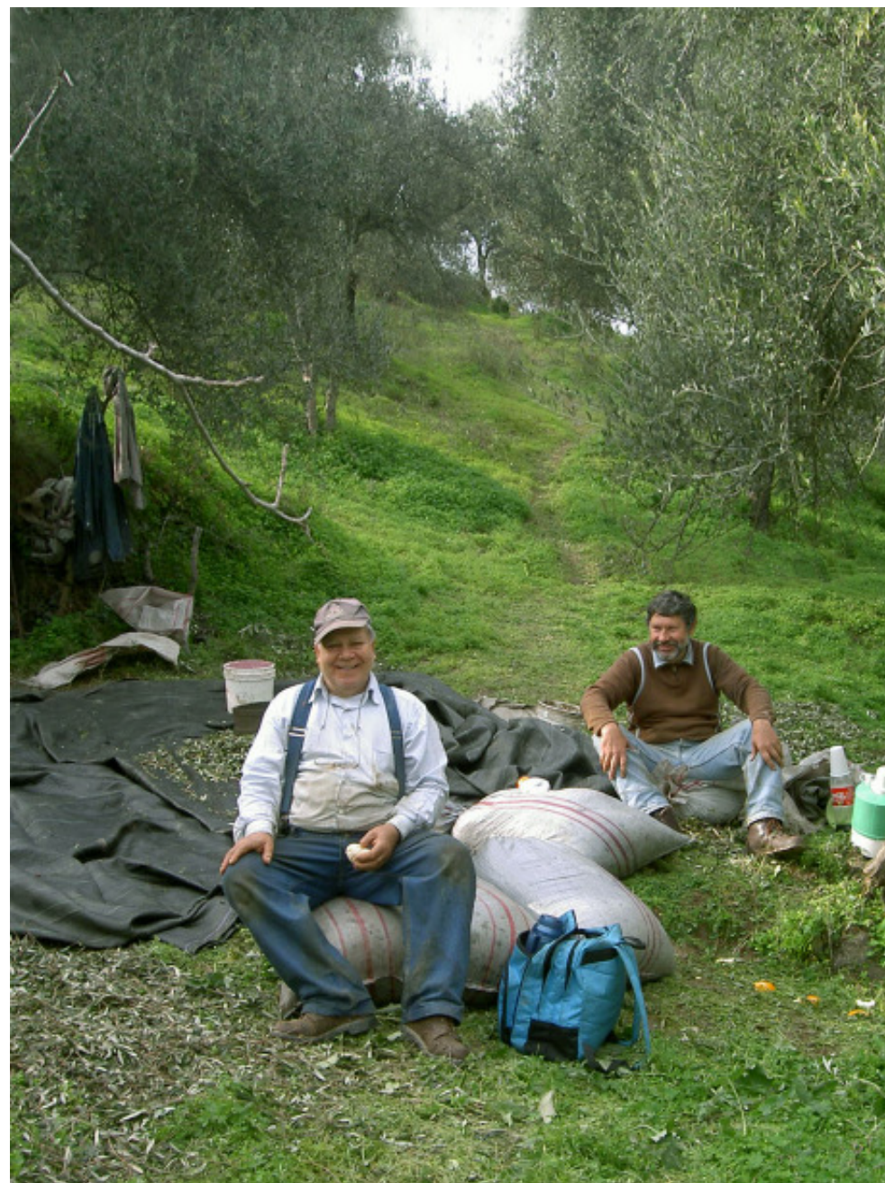
Stora snubbar med ordentliga kängor i olivlunden!