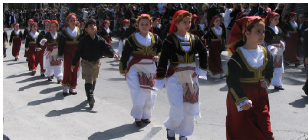
Parad på Nationaldagen

Vigsel: Det går utmärkt att komma hit och viga sig, dock ej i kyrkan, det tillåts inte. Jag blev tillfrågad om jag kunde ordna med en vigsel och "visst" tänkte jag och tuffade iväg och hittade damen som hade hand om det hela. Jag bokade vigsel i lilla kapellet (gifta sig på rådhuset är för trist och utlänningar får inte gifta sig i kyrkan) och fick nödvändiga papper från Sverige nedsända, så det gick hyfsat smidigt att fixa det hela. Det höll på att spricka när hon frågade vad de hade för yrke och religion. Yrke vågade jag inte dra till med (hade nog inte spelat någon roll) men jag sa att de är protestanter, religion kan man inte vara utan här nere så jag skrev till dem att vad ni nu än är så är ni protestanter när ni skall gifta er, om någon frågar. Ja, ok då kan vi väl vara det då svarade de! Jag mailade kartor mm för att de säkert skulle hitta till kapellet, det är inte