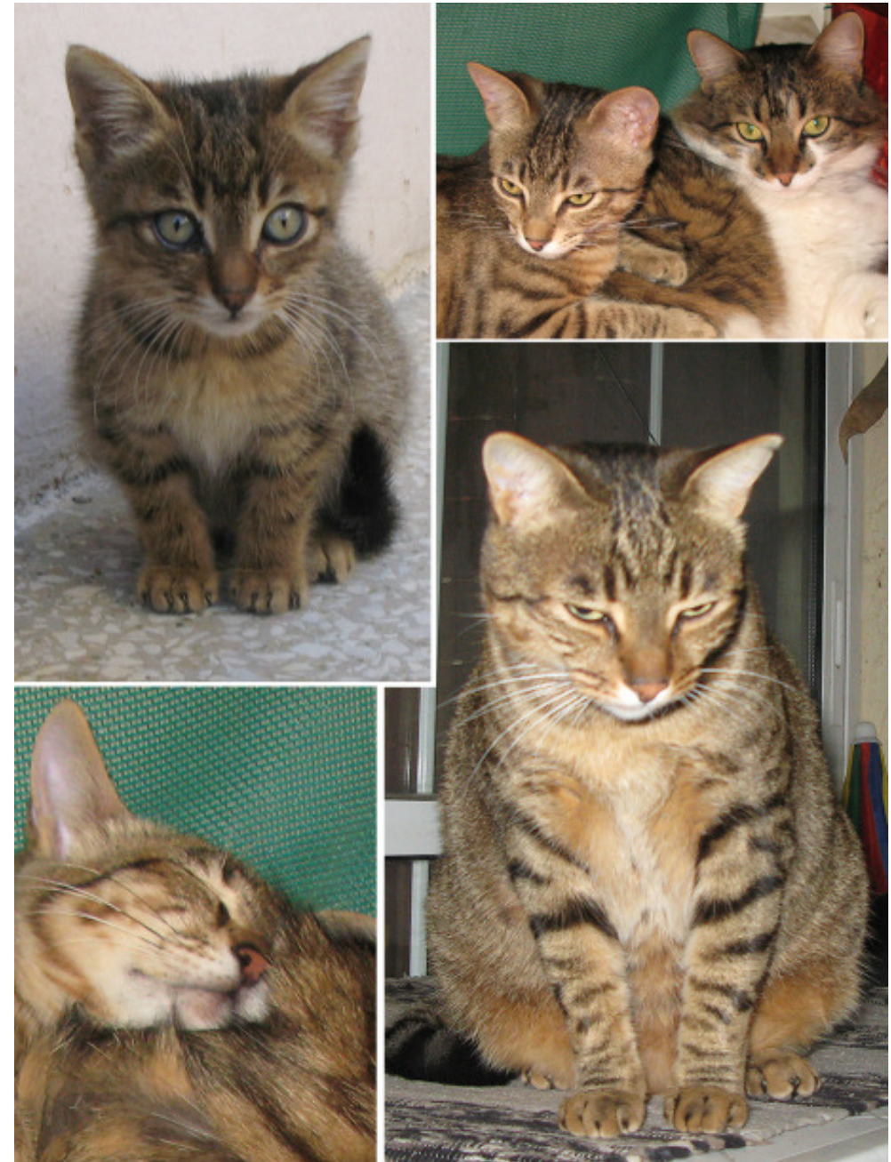
Lussan! Att en sådan liten söt en kan bli så stor!

Jag knycker ett citat "En kan inte göra allt! Men alla kan göra något"