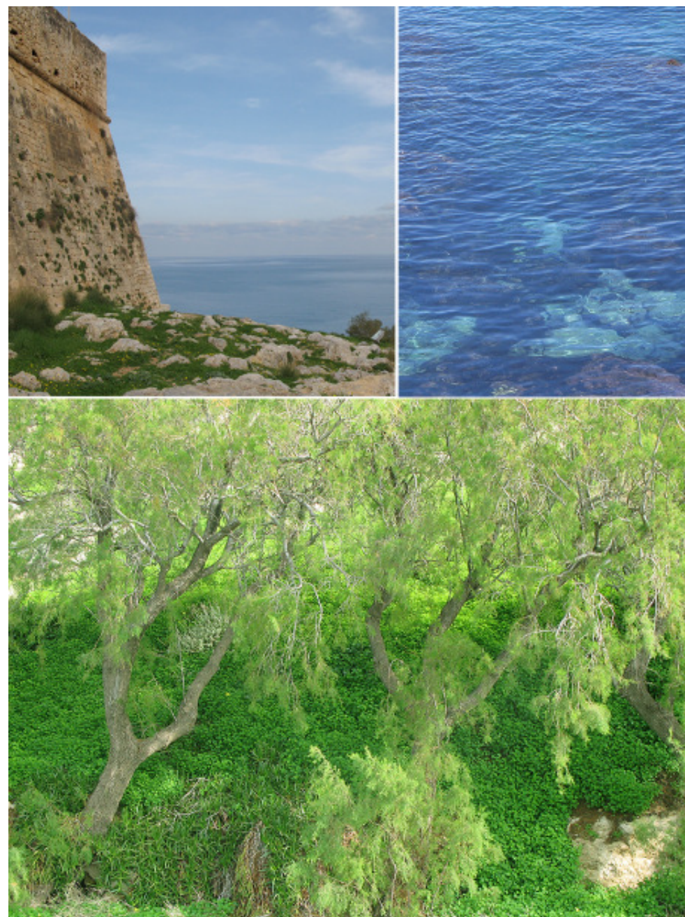
Vinterbilder, tagna i december

Många svenska kvinnor som gifter sig och skaffar barn här nere upptäcker förr eller senare att det kostar på en hel del att anpassa sig till det grekiska synsättet, med tanke på familjens starka ställning så är det inte bara maken som har en del att säga till om. Den dagen barnet kommer kan man räkna med att svärmor kommer att vilja styra och ställa precis när hon vill och hur ofta hon vill. Ofta är det dessutom så att svärmor bor strax intill eller t o m i samma hus. Det är inte ovanligt att svärföräldrarna anser det som en självklar rätt att ha nyckel så de kan gå och komma som de vill. Det säger sig själv att för den som växt upp i Sverige inte känner sig helt hemma med det här synsättet, att svärfar kan komma och gå in i ditt hem, exempelvis just när du kommer ut ur duschen. En vännina sa så här, "du milde när vi fick barn var det nästan som om jag fått barn med hans mamma".