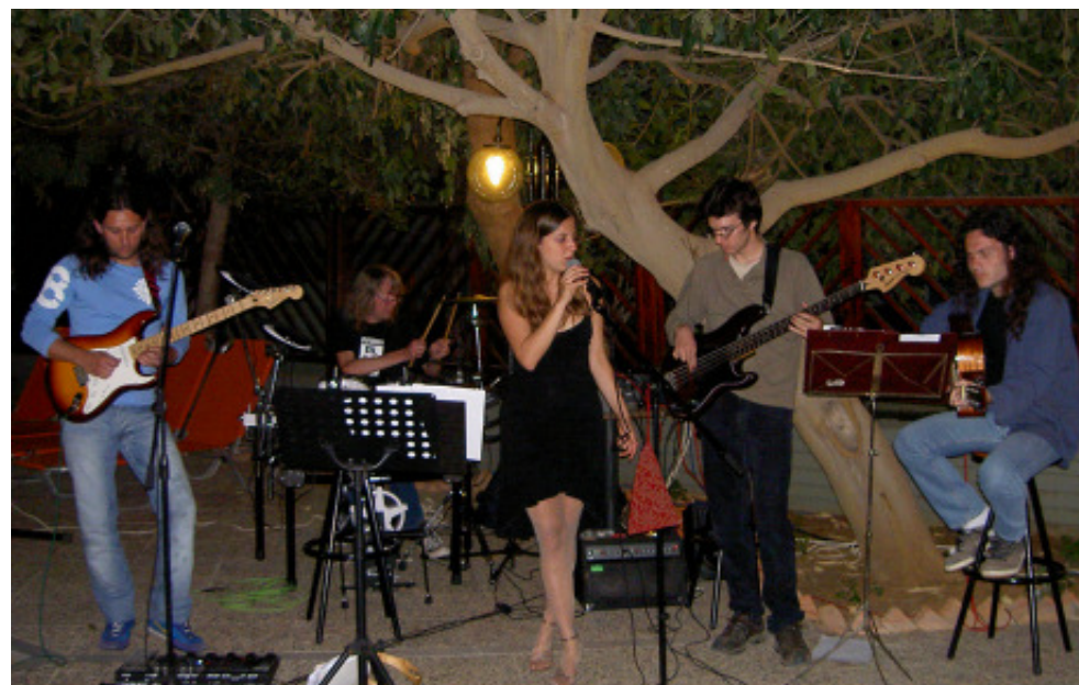
Driving South i högform!

Det var bara att inse att enda sättet var att ge sig ut på stan utrustad med karta, penna och block, traska gata upp och gata ner och så där höll vi på i veckor. Vi samlade in visitkort och skrev så pennorna glödde. Adresser och telefonnummer. Så småningom så fick vi ihop något som var värt namnet "Rethymnogueide" och kunde börja presentera den för restaurangägare och andra intresserade. Mr G var den första som fick se